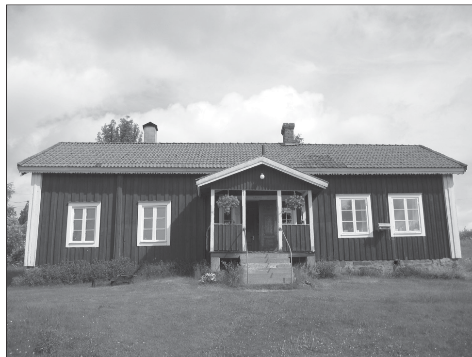
Røykstua i Mattila.

Diskusjon og innspill fra deltakerne innen konferansens tema