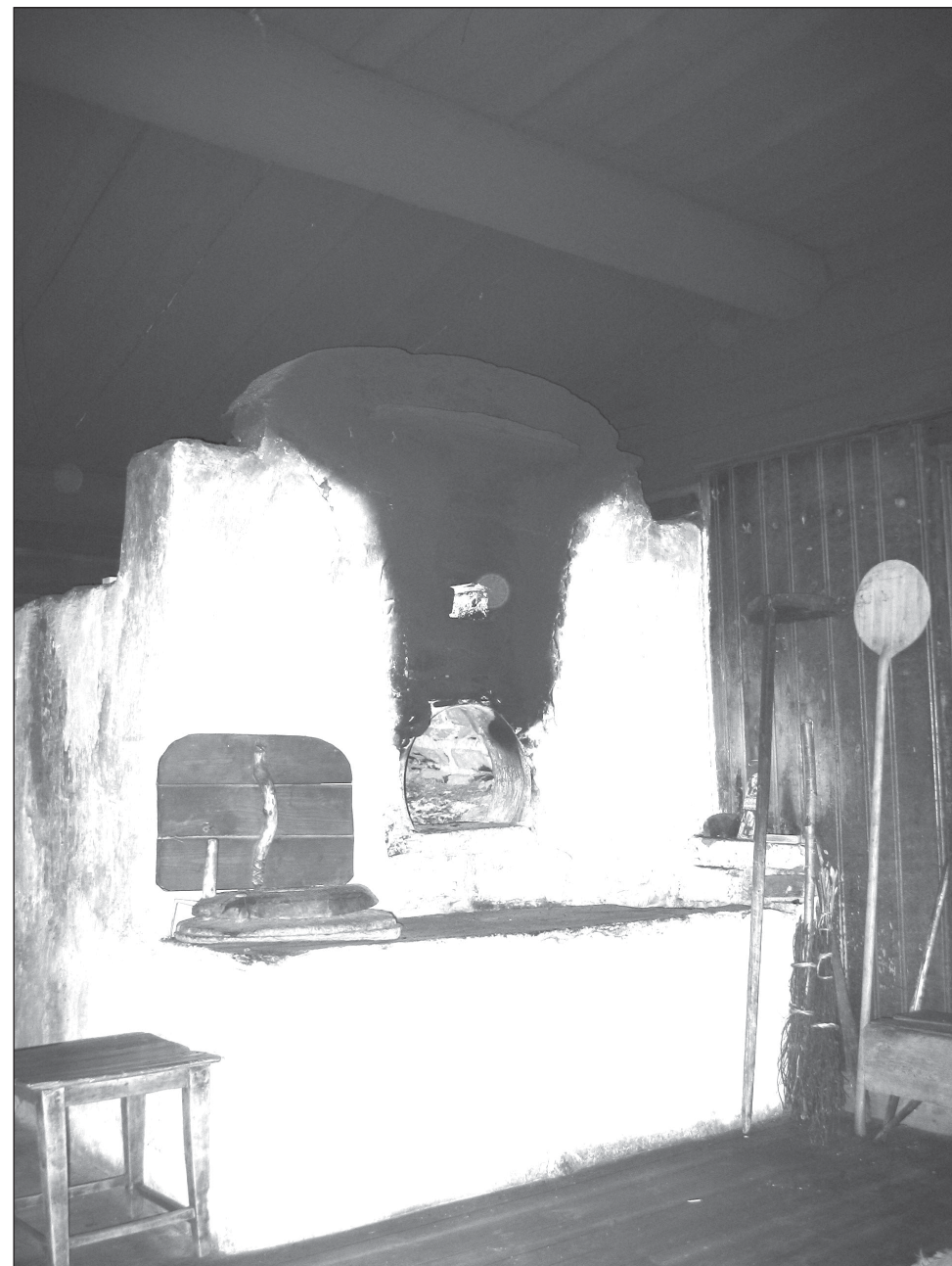
Roykovnen i Mattila. (Foto: Jan Myhrvold 2005).